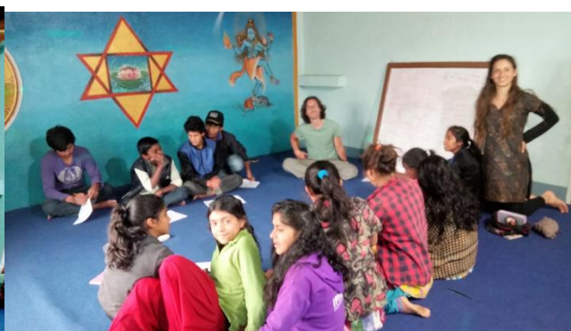
Spectacle pour les 24 ans de la MAE de Katmandou Cours de Français